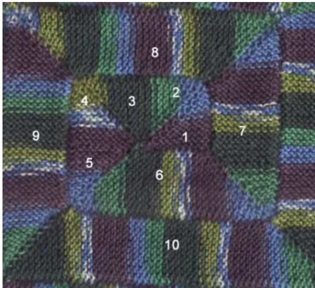
Anschlag 12 M